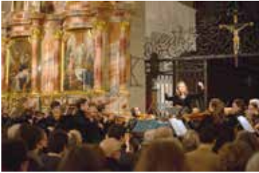
Am zweiten Luzerner Singalong am 30. Dezember 2014.